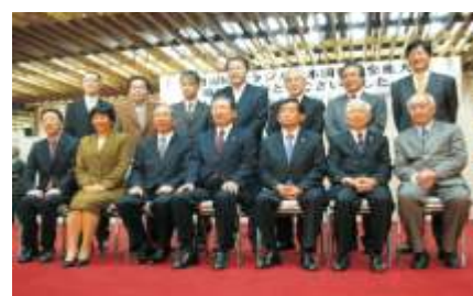
Cerimônia reuniu autoridades no Bunkyo em São Paulo

Em setembro, a Aliança Cultural Brasil-Japão participou da cerimônia de despedida ao embaixador do Japão no Brasil, Ken Shimanouchi . O evento reuniu 150 pessoas e foi prestigiado por representantes da comunidade nipo-brasileira e autoridades.