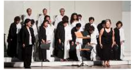
Coral Misto da Assoc. Cultural Nipo-Brasileira de Araçatuba