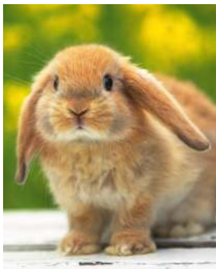
2011 é o Ano do Coelho no horóscopo oriental

Será um ano em que não obterá resultados em nada do que fizer. Necessário ter perseverança, paciência e resignação. Não se entusiasmar demasiadamente em uma forma específica de diversão. Será necessário o autocontrole para cumprir com as responsabilidades e parar com gastos excessivos e atitudes que prejudicam a saúde. Tenha cuidado com a saúde e