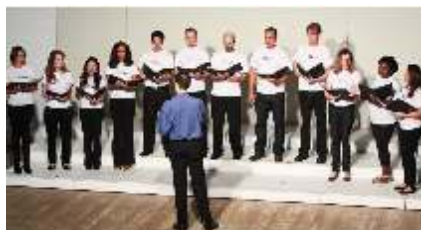
Coral da FAPESP, pela primeira vez no Festival