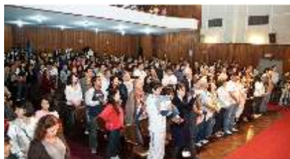
Visão geral do público do Festival de Canto Coral