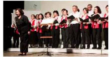
Coral da Aliança Cultural Brasil-Japão