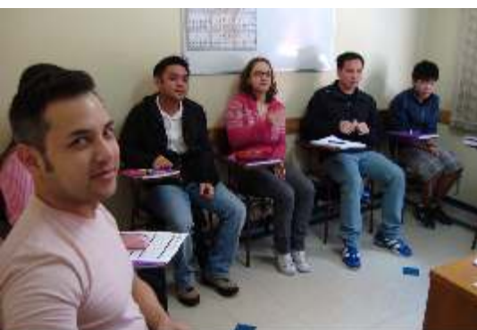
Cursos intensivos permitem completar um módulo em um mês

A Aliança Cultural Brasil-Japão está com inscrições abertas para os cursos intensivos de férias (em janeiro) e para os cursos regulares do primeiro semestre de 2011 (início em fevereiro).