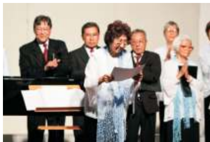
Ashibue recebe homenagem pela participação desde o primeiro festival