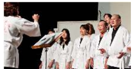
Coral do Karaokê Acae, de Presidente Prudente