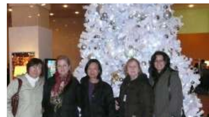
Próxima viagem será em março de 2011

Em 2009, graças a adesão de mais professores de outras técnicas, como washi e oshibana e alunos, parentes e amigos e pessoas de outros estados, conseguimos formar um grupo com mais de 50 pessoas para realizar esta viagem. Este grupo foi denominado Grupo de Artes Manuais .