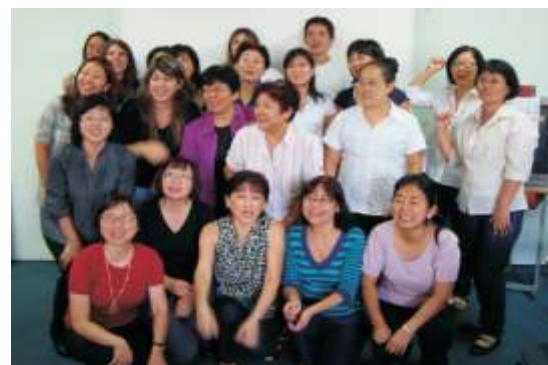
Professores da Aliança Cultural Brasil-Japão motivam os alunos, para 87% dos estudantes entrevistados

87% dos alunos responderam que os professores incentivam os alunos e 97%