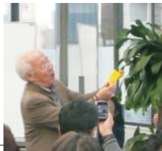
Kobayashi sensei demonstra arte do origami

Depois fomos para o andar onde funciona a loja, onde o professor continuou a fazer a sua demonstração, e por vezes, era interrompido por pessoas que tinham adquirido um de seus livros e queriam tê-lo autografado por ele. À nossa volta, aliás, havia muitas pessoas que pareciam perdidas no