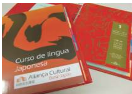
Material didático foi bem avaliado na pesquisa de satisfação

Quanto ao interesse por outras línguas, 31% dos alunos falam inglês e 8%, espanhol. Um outro dado a destacar é que 71% dos alunos da ACBJ possuem ascendência japonesa e 29% não são descendentes (percentual que tem