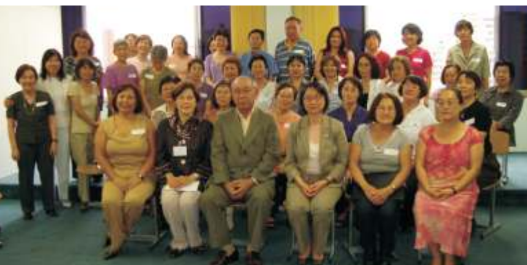
Técnicas vocais foram tema da palestra realizada na unidade São Joaquim

Em novembro, a Aliança Cultural Brasil-Japão promoveu um workshop musical com Yoko Tanaka , esposa do ex-embaixador do Japão no Brasil, Katsuyuki Tanaka.