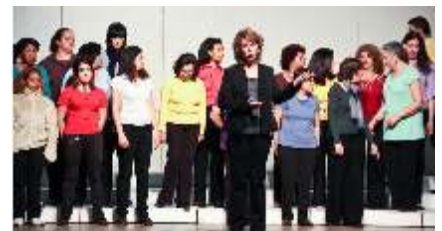
Oficina de Canto Coral do Centro Cultural São Paulo